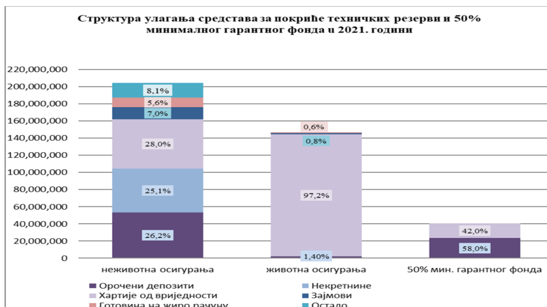
Grafikon 2. Struktura ulaganja sredstava za pokriće tehničkih rezervi i 50% minimalnog garantnog fonda u 2021. godini (u KM)

Nezavisno od činjenice da, posmatrano sa stanovišta prosjeka sektora, postoji disperzija ulaganja sredstava za pokriće tehničkih rezervi neživotnih osiguranja, na nivou pojedinačnih