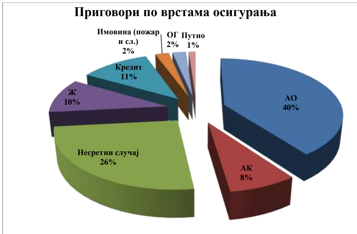
Графикон 3: Приговори по врстама осигурања

У извјештајном периоду највећи број приговора се односио на осигурање од одговорности за моторна возила и ауто - каско осигурање.