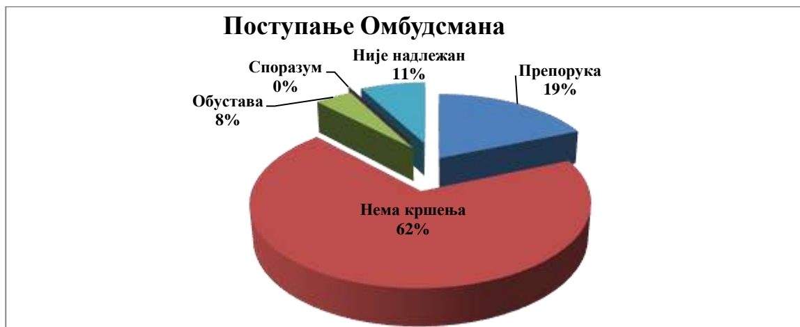
Графикон 6: Акти Омбудсмана