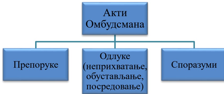
Графикон 5: Врсте аката Омбудсмана

У наредној табели дат је преглед начина рјешавања по приговорима / захтјевима за вансудско рјешавање спора и подаци о другим писаним поднесцима, уз напомену да два предмета нису окончана, односно у току је поступак рјешавања.