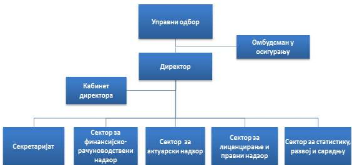
Графикон 1: Организациона структура Агенције