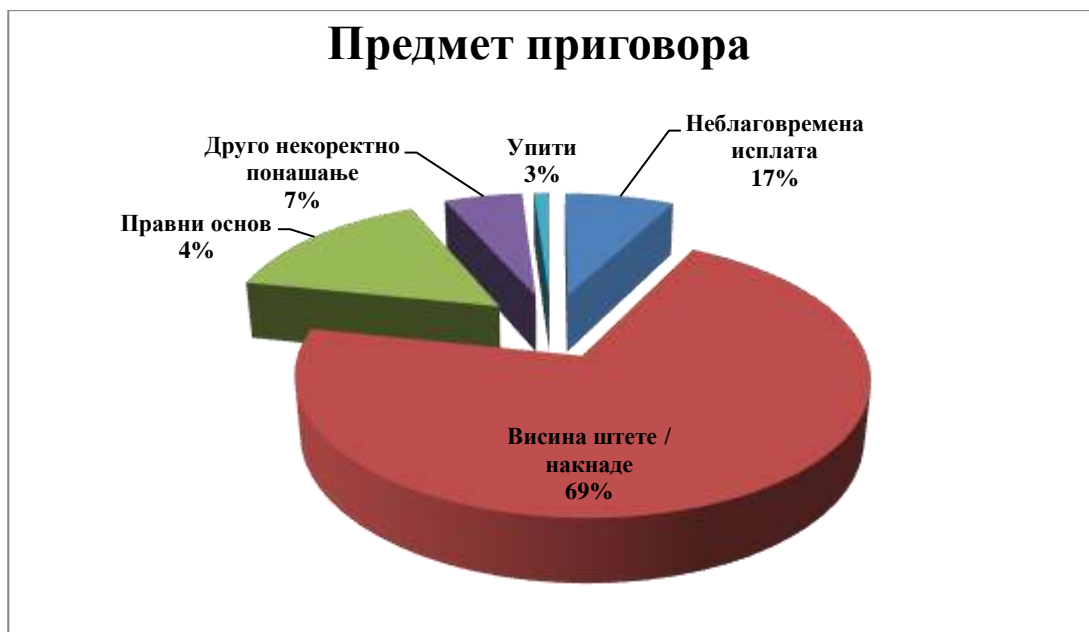
Графикон 4: Предмет приговора

Међутим, Омбудсман нема овлашћења да се упушта у утврђивање висине накнаде штете, које право припада искључиво друштву за осигурање или евентуално суду 11 . Због наведеног ограничења, у извјештајном периоду највише је донијето аката којима Омбудсман констатује да друштво није прекршило Кодекс пословне етике и добре праксе у осигурању.